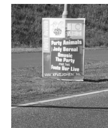
Sandwich frame met tie wraps