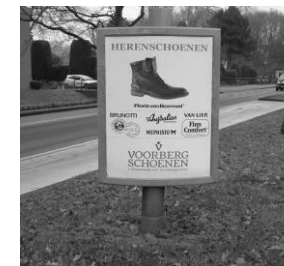
Vast A0 dubbelzijdig frame