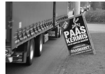
Sandwich driehoek frame (los)

Accompany Media is gevraagd om een marktverkenning uit te voeren met als resultaat duidelijkheid te verschaffen over de mogelijkheden van het door derden laten exploiteren van A0 formaat in analoge en/of digitale uitvoering in de gemeente Wijchen. De marktverkenning wordt uitgevoerd door de Accompany Media adviesgroep.