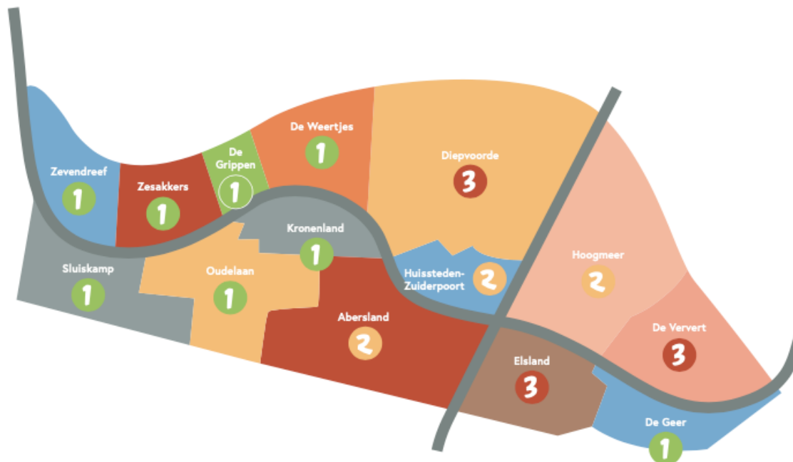
Kaartje Wijchen Zuid uit Routekaart 'Toekomst Hart van Zuid' d.d. september 2019.

Het voorzieningshart is voor heel Wijchen Zuid. Dit participatieplan richt zich dan ook tot geheel Wijchen Zuid.